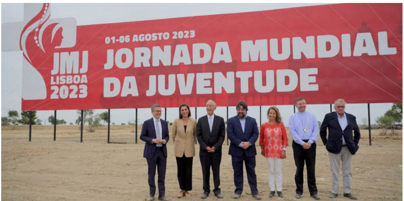
Presidente da República, autarcas e organização do evento numa visita ao espaço dedicado às JMJ