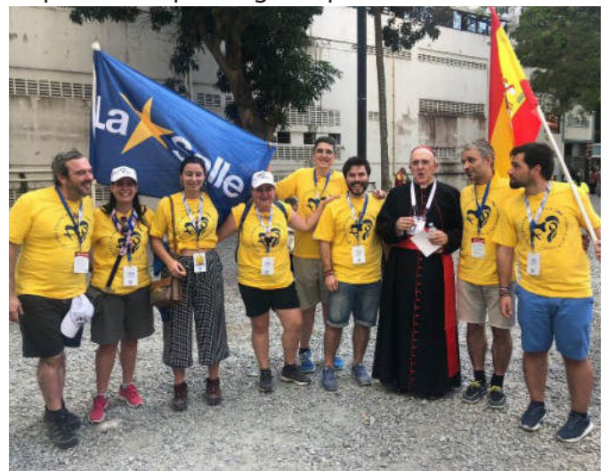
Lassalistas nas JMJs do Panamá, 2019.

organizativo e, sobretudo, um bom resultado em atingir os grandes objectivos finais do megaencontro. Destacamos a mensagem do Papa Francisco onde se revela a razão de ser e o alcance pretendido: "Espero e creio fortemente que a experiência que muitos de vós ireis viver em Lisboa, no mês de Agosto do próximo ano, representará um novo começo para vós jovens e, convosco, para toda a humanidade". A alegria do encontro fraterno entre os povos e as gerações. E do abraço da paz. E o sonho de Francisco: "Sonho, queridos jovens, que na JMJ possais experimentar novamente a alegria do encontro com Deus e com os irmãos e as irmãs. Depois dum prolongado período de distancia-