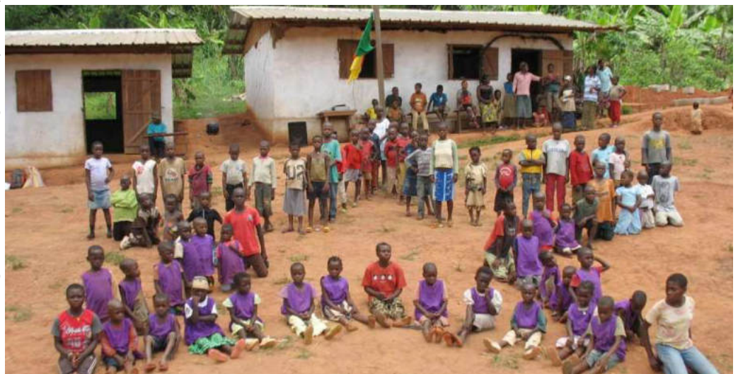
Centro Educativo Baka

Os Baká são todos caçadores-coletores. Com alturas médias de 1,52 metros (5 pés), bem como estilos de vida semi-nómadas, são frequentemente discriminados e marginalizados da sociedade. "São privados das suas terras e espoliados dos espaços ancestrais, e são desprezados e desrespeitados" e, por vezes massacrados por outras etnias de não pigmeus. A par disso "continuam a desempenhar um papel inegável na protecção da floresta tropical da bacia do Congo" no depoimento do Coordenador nacional da Dinâmica dos Grupos dos Povos Autóctones da RDC. A bacia do Congo, pátria de várias etnias de pigmeus, é conhecida pelo "pulmão de África". A riqueza em biodiversidade é enorme em espécies arbóreas e de mamíferos, de borboletas e de répteis. Lá existe a maior área de turfa do mundo. (OBS: É admirável o texto da jornalista Margarida Santos Lopes inserido na revista Além-Mar de Dezembro deste ano de 2022. Recomenda-se a sua leitura).