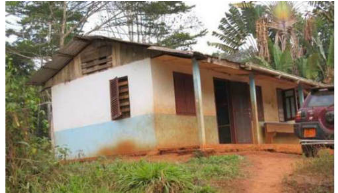
A casa dos Irmãos no projeto Baka.

A Direcção compromete-se a informar os AA