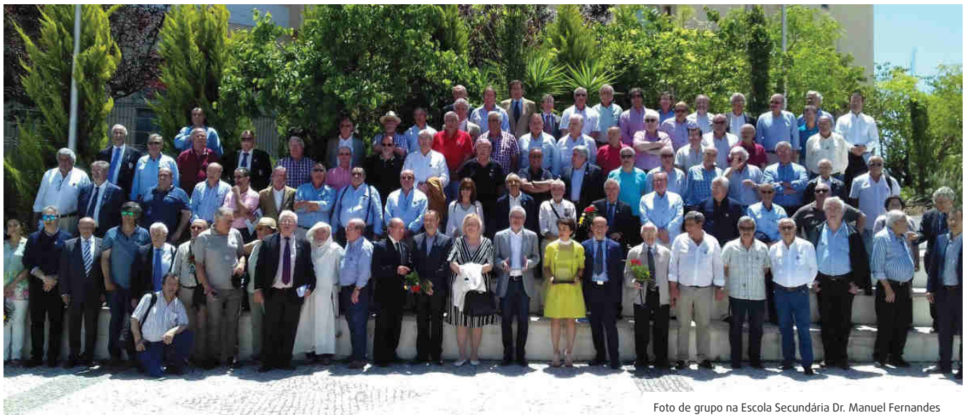
Foto de grupo na Escola Secundária Dr. Manuel Fernandes